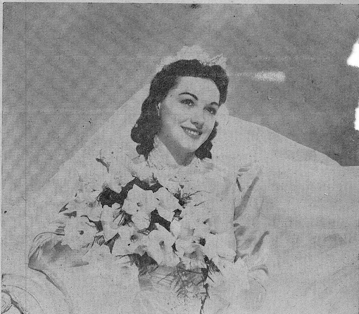
Esta encantadora novia de Georgia, dice:

"De los Jabones que he usado me agrada el CAMAY como el mejor de todos".